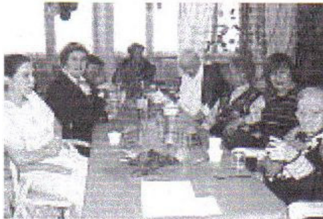
Les résidents et leur famille ont été invités au repas du long séjour.

Les résidents du long séjour et leur famille, les associations qui les accompagnent et le personnel soignant ont mis les petits plats dans les grands au cours du repas de Noël offert par l'hôpi-